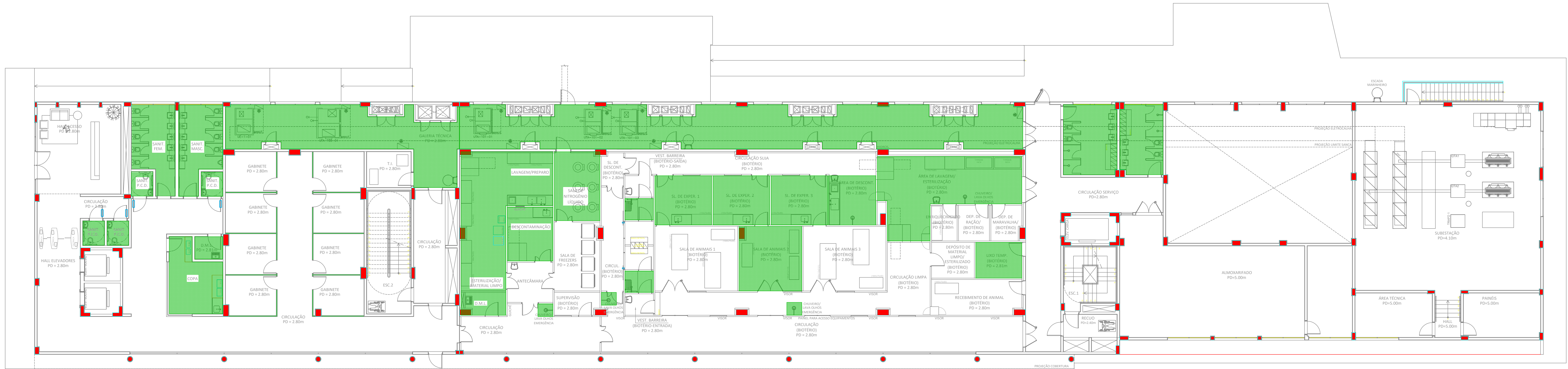
PLANTA BAIXA - 1º PAVIMENTO ESCALA 1/100